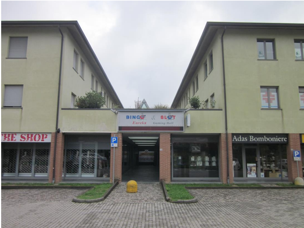
Fotografia 2: ingresso galleria