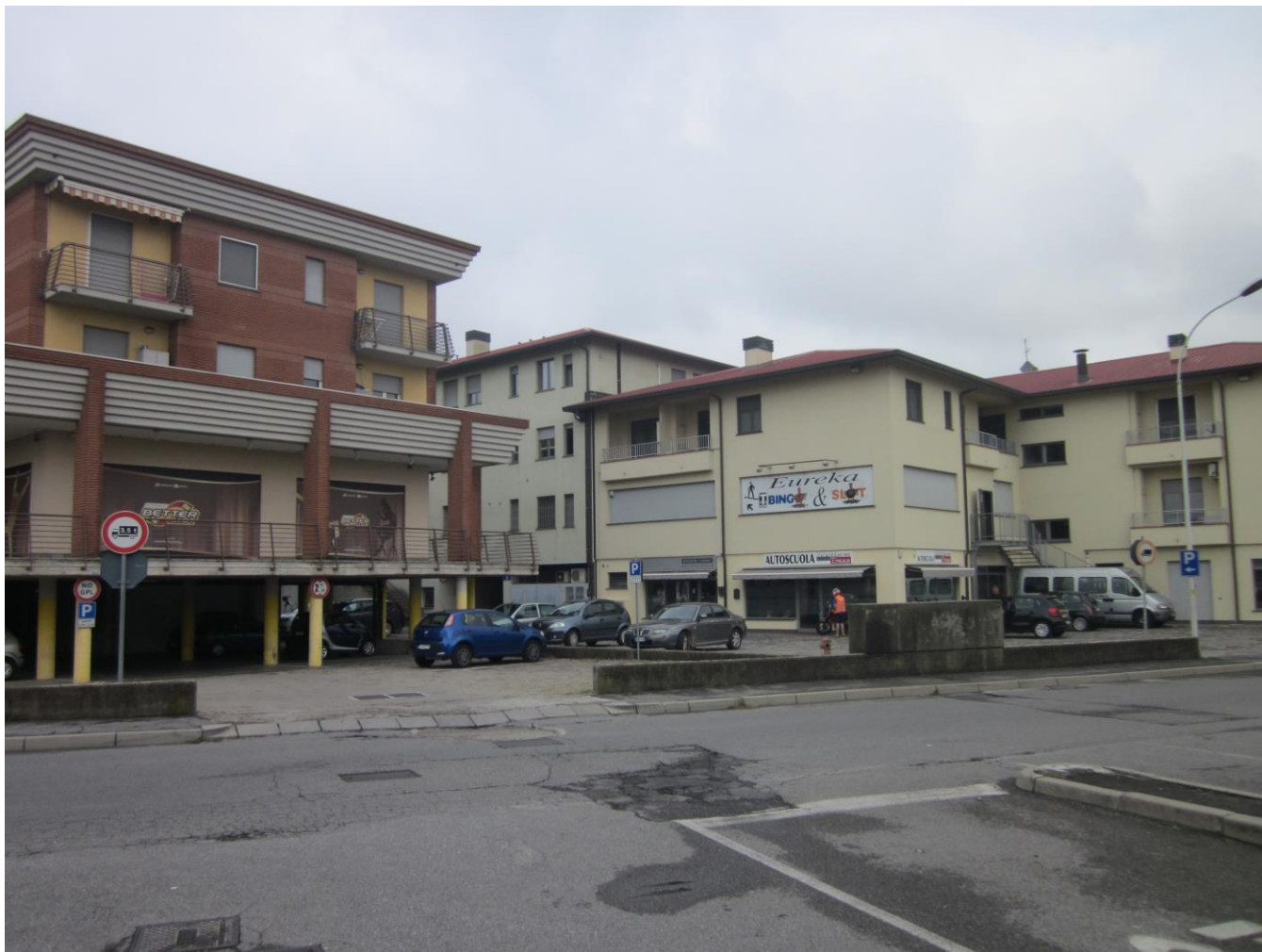
Fotografia 1: vista retro sala slot e sala bingo

Trasferimento sala slot da sede distaccata a locali annessi all'attività Bingo in variante al Piano di Governo del Territorio