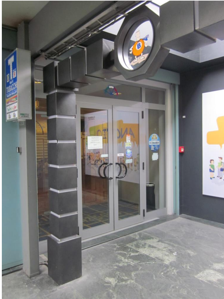
Fotografia 4: ingresso bingo da galleria