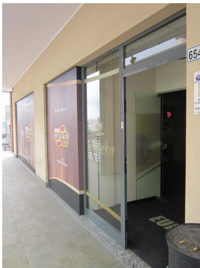
Fotografia 6: ingresso sala slot da ballatoio