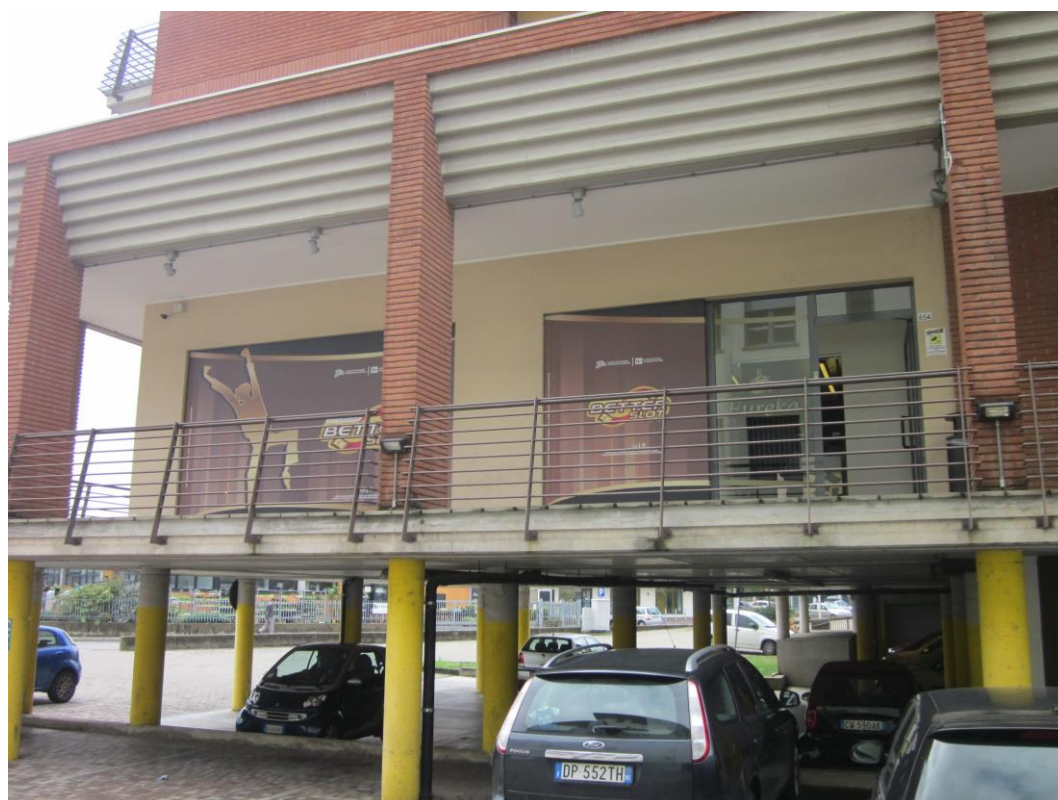
Fotografia 7: fronte sala slot AWP/VLT