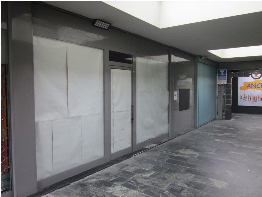
Fotografia 3: vista negozio futura sede sala slot