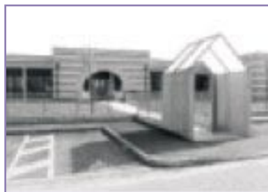
Asl - Sede futura del Punto Prelievi

Non si considera più solamente l'indicatore I.S.E.E., ma il richiedente deve anche incontrare l'assistente sociale del comune che verificherà l'entità e la natura del suo bisogno e stilerà una relazione con la proposta di soluzione da sottoporre alla giunta per ottenerne l'approvazione.