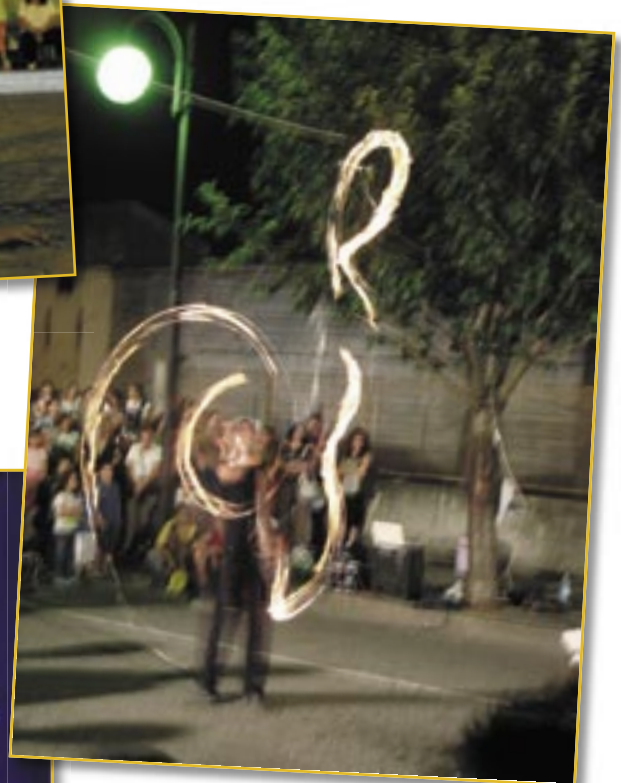
2° premio di Euro 200,00. = al Sig. Stefano Vimercati per la foto "Segni di fuoco"