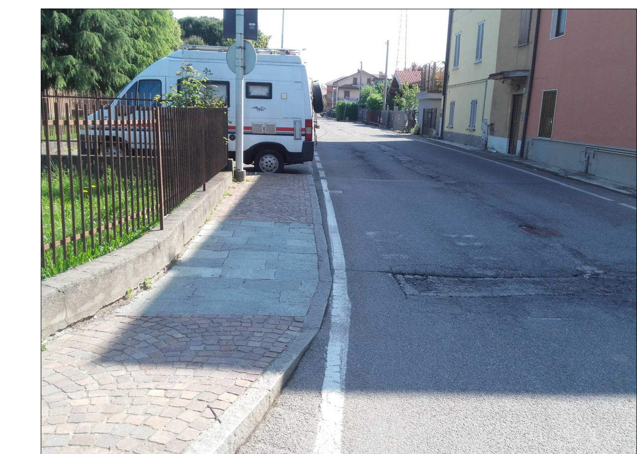
Ripresa fotografica n. 14