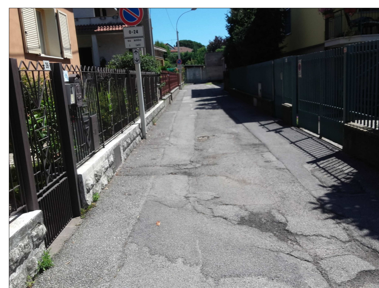
Ripresa fotografica n. 17