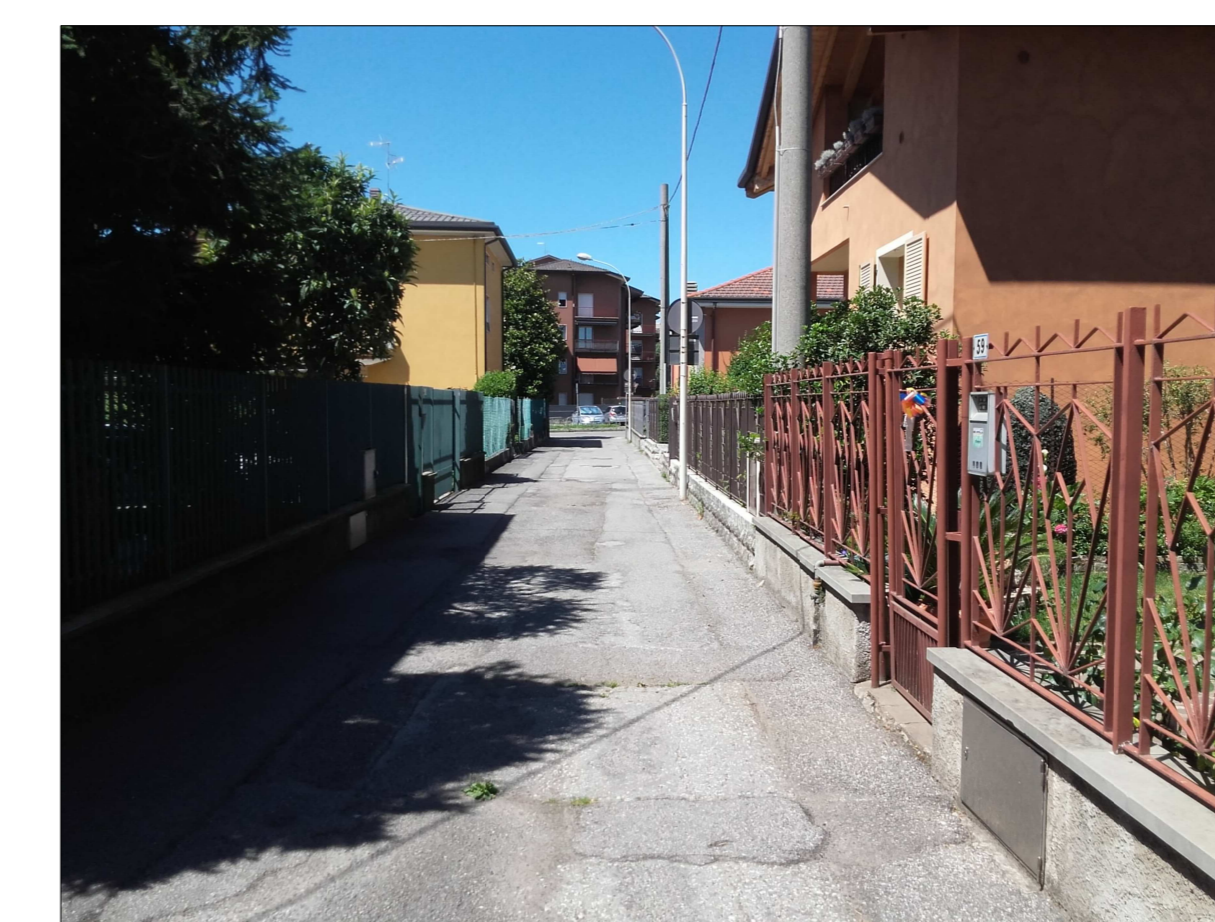
Ripresa fotografica n. 18