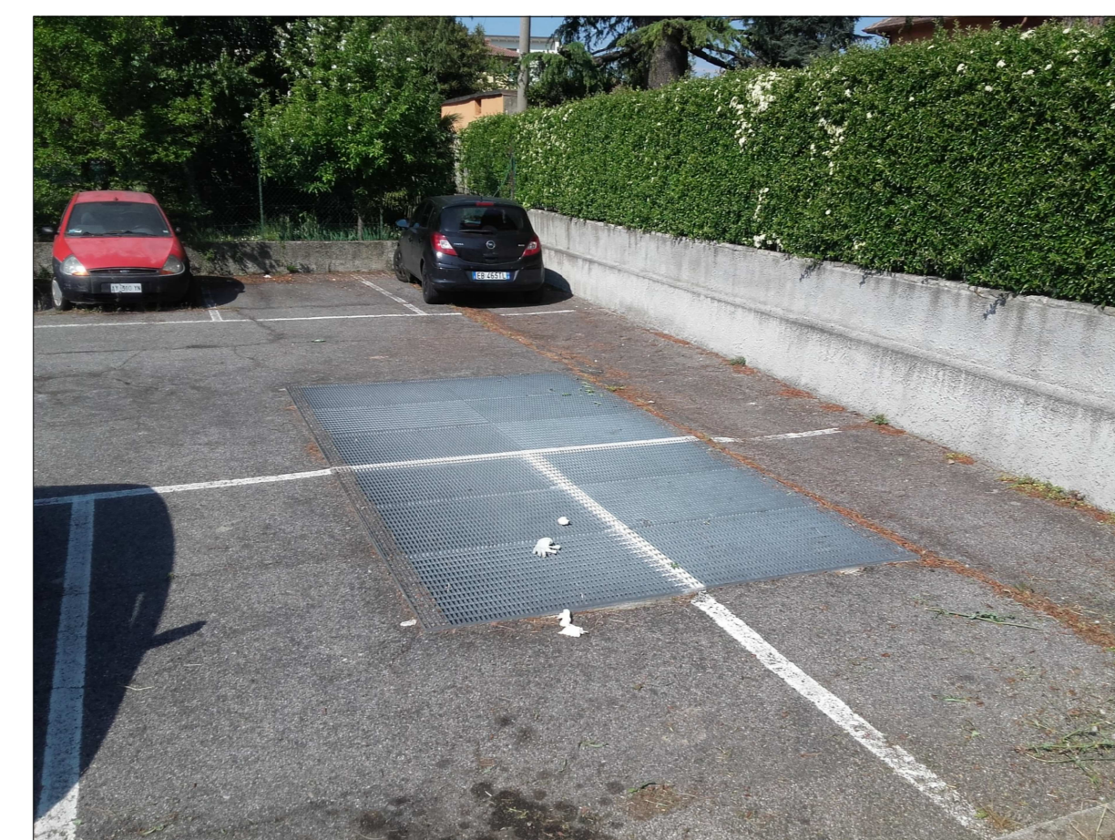
Ripresa fotografica n. 11