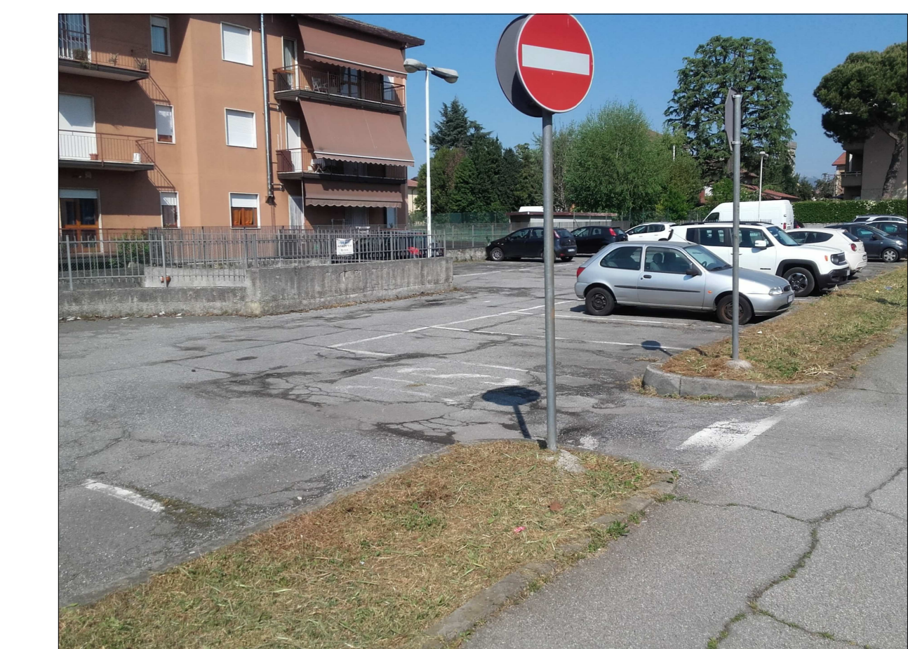
Ripresa fotografica n. 9