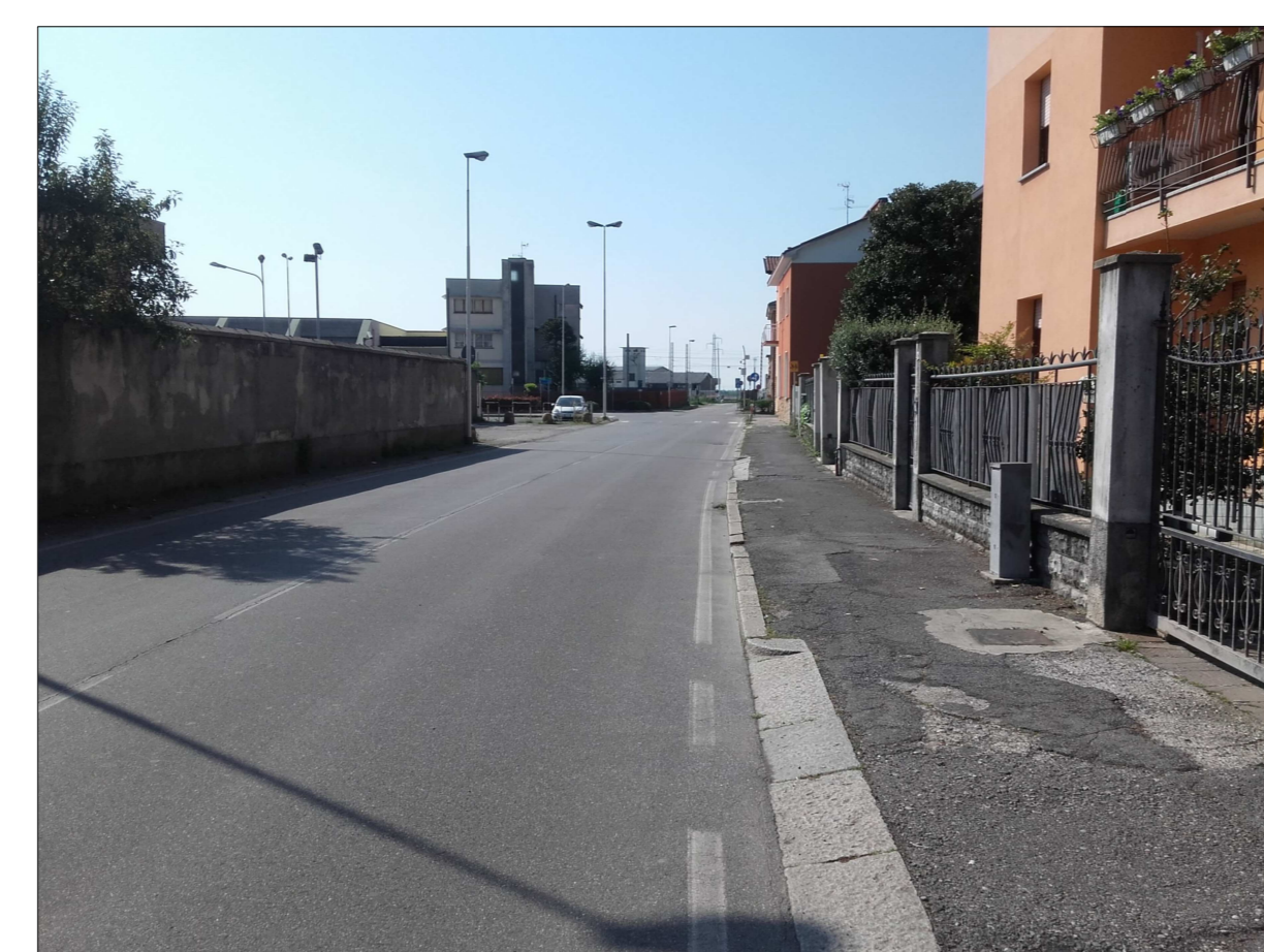
Ripresa fotografica n. 16