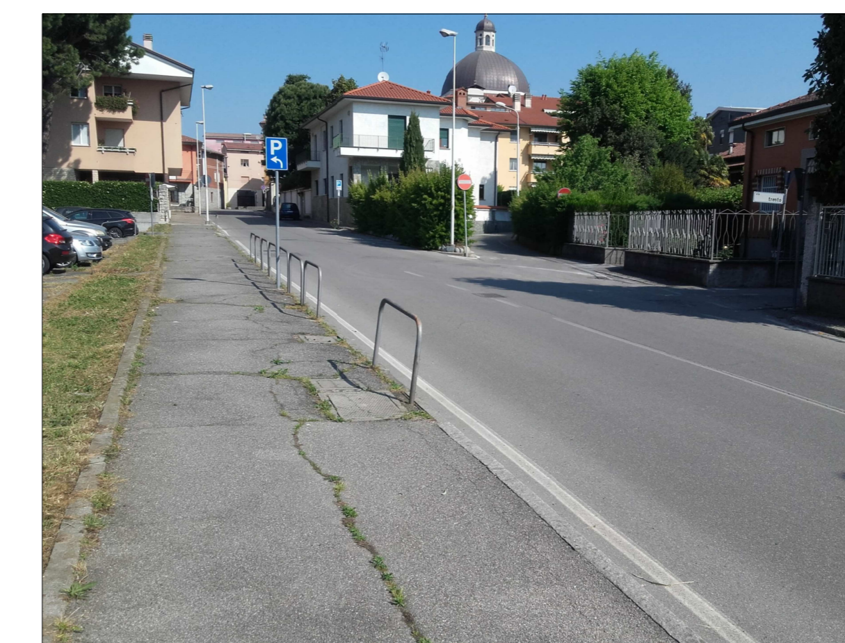
Ripresa fotografica n. 8