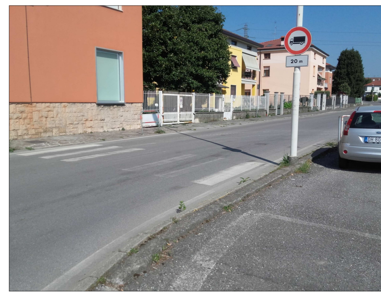
Ripresa fotografica n. 1