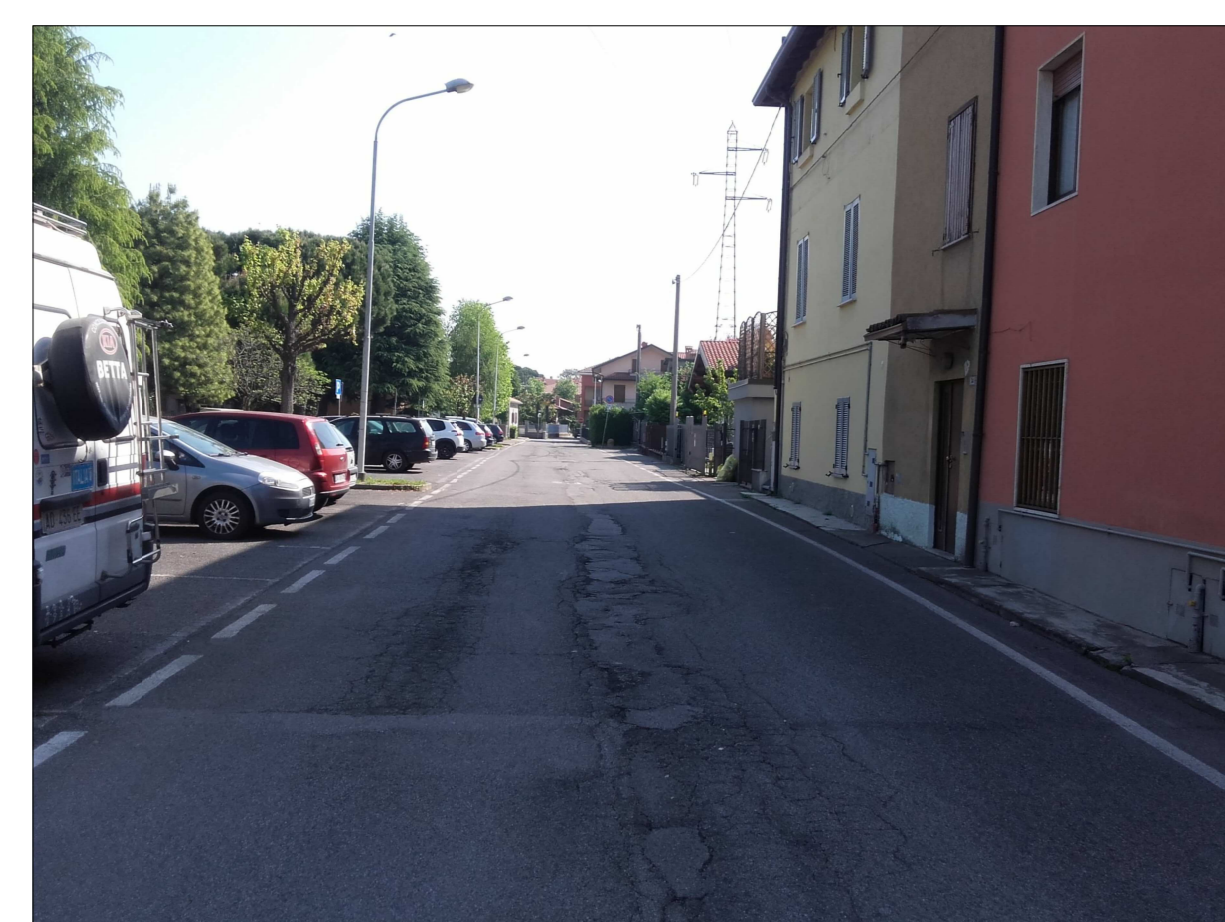
Ripresa fotografica n. 15