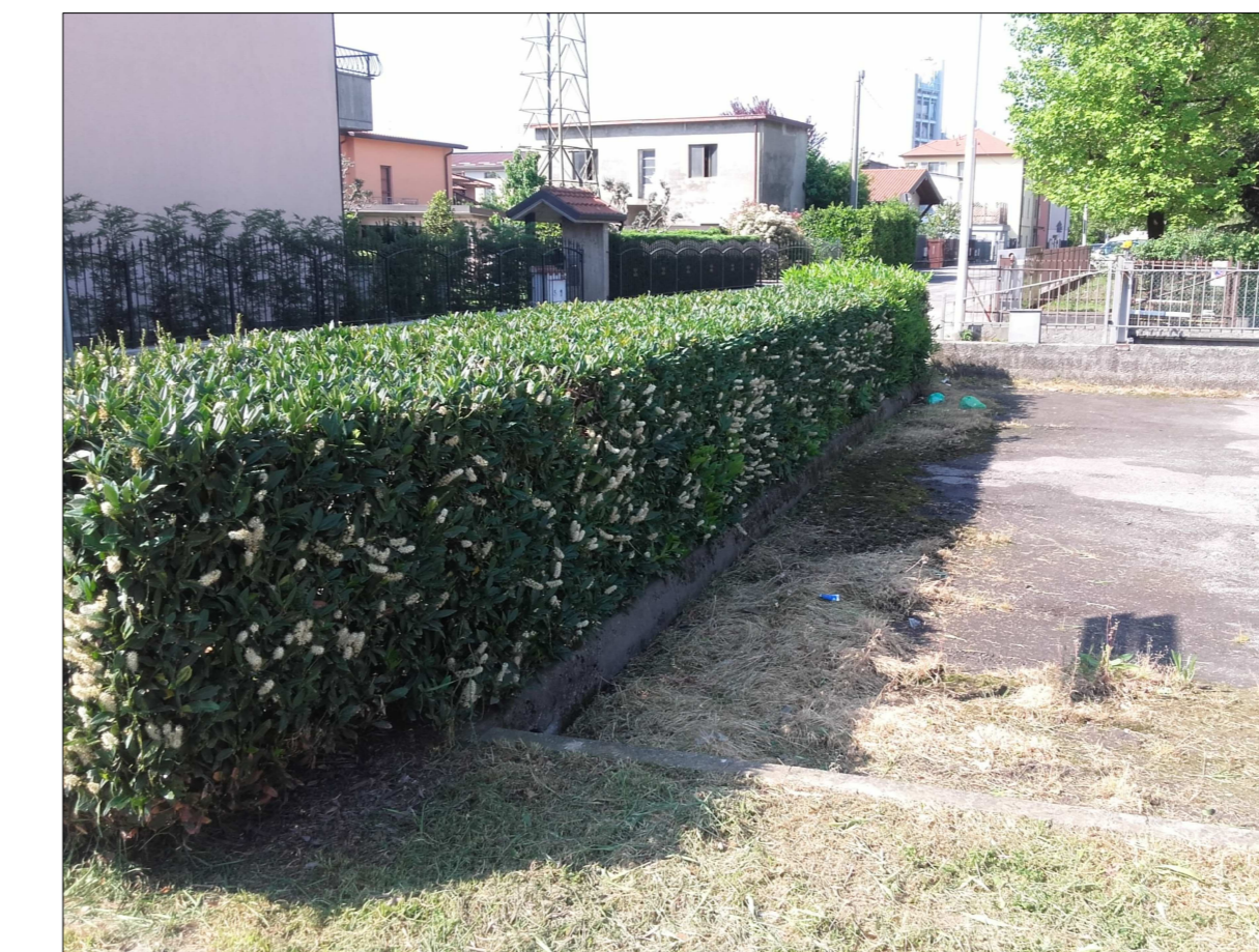
Ripresa fotografica n. 5