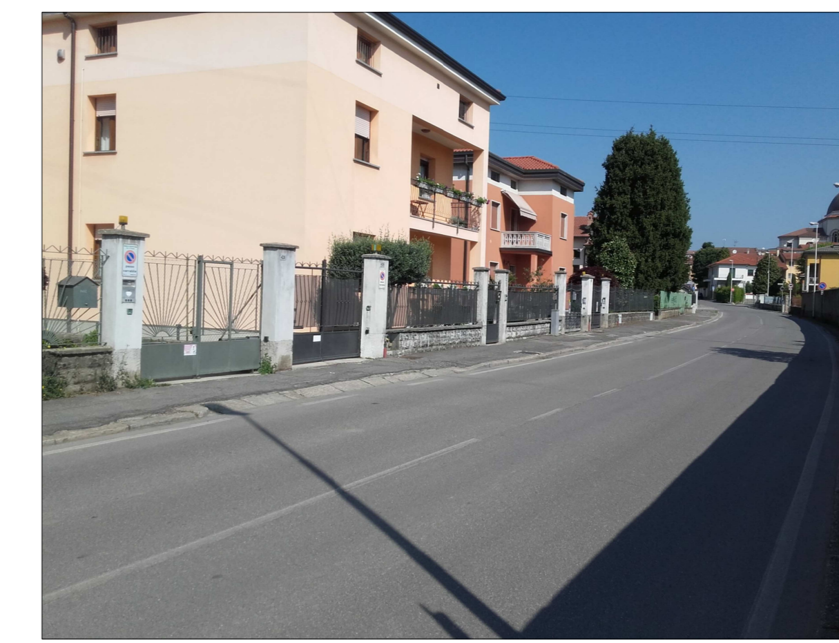
Ripresa fotografica n. 2