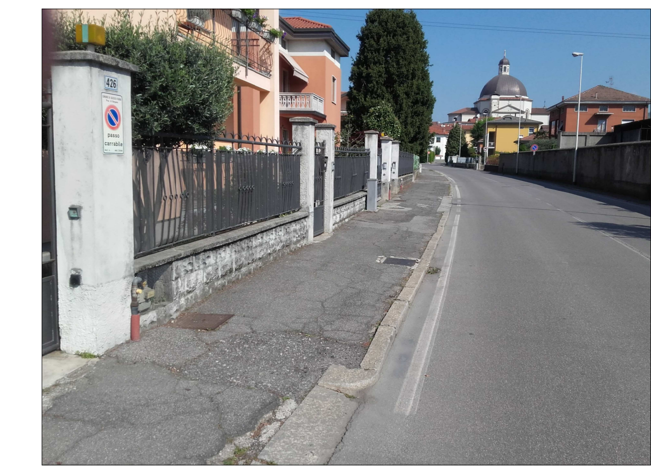
Ripresa fotografica n. 3