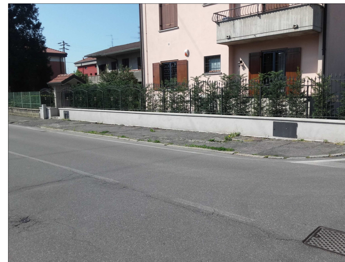
Ripresa fotografica n. 4