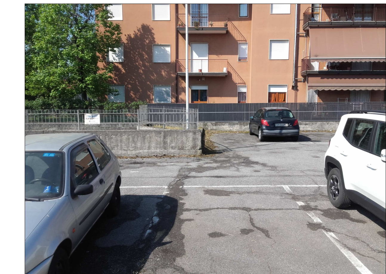
Ripresa fotografica n. 6