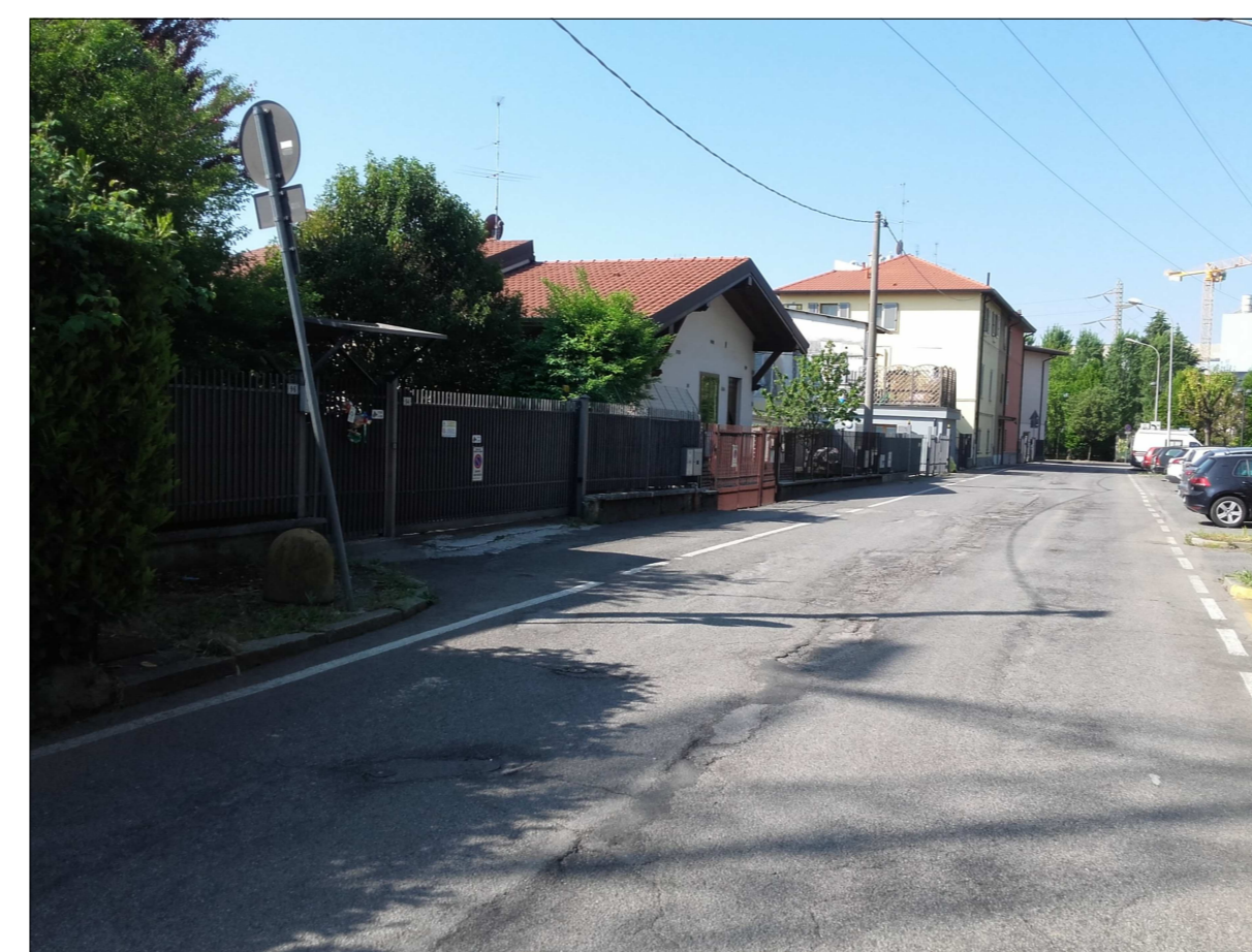
Ripresa fotografica n. 12