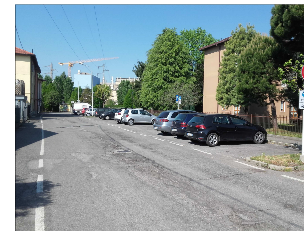
Ripresa fotografica n. 13