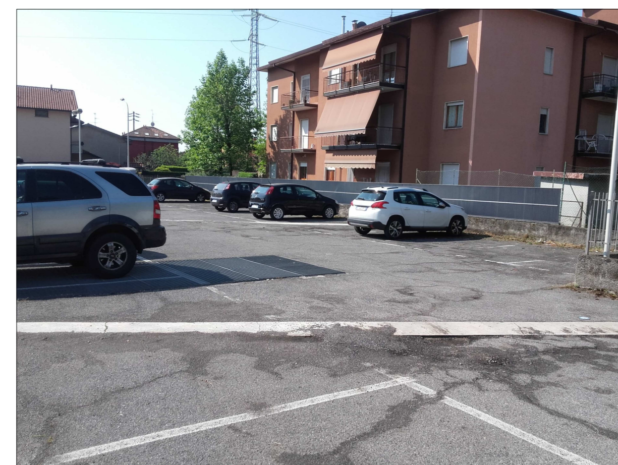
Ripresa fotografica n. 10