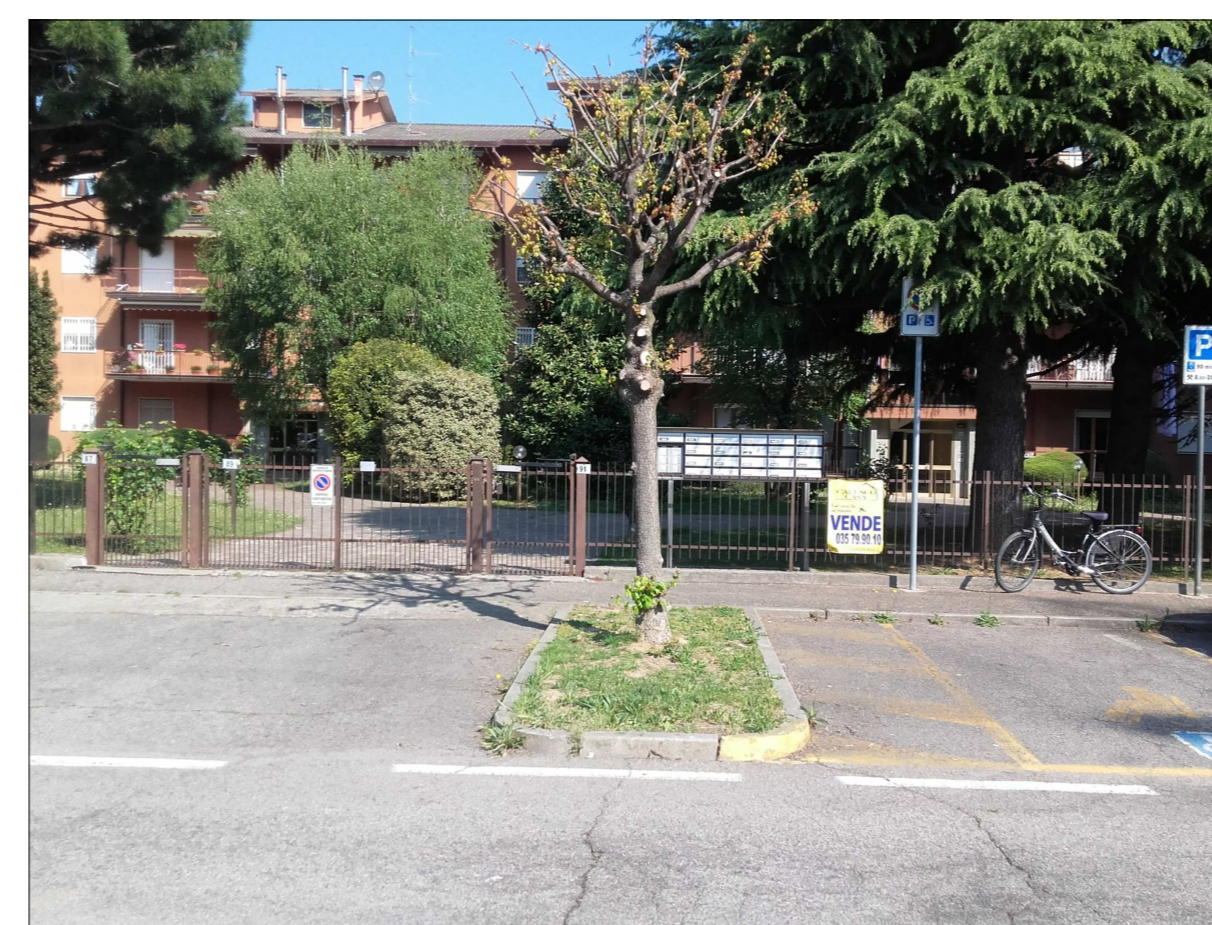
Ripresa fotografica n. 7