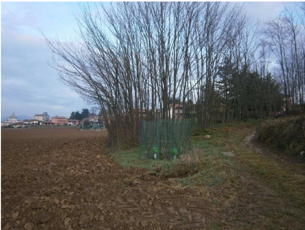
Foto n. 50 - Manufatti Consorzio di Bonifica non interessati dall'intervento