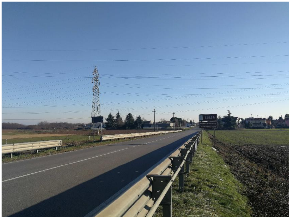
Foto n. 8 - Vista SP 170 direzione Solza - Scarpata