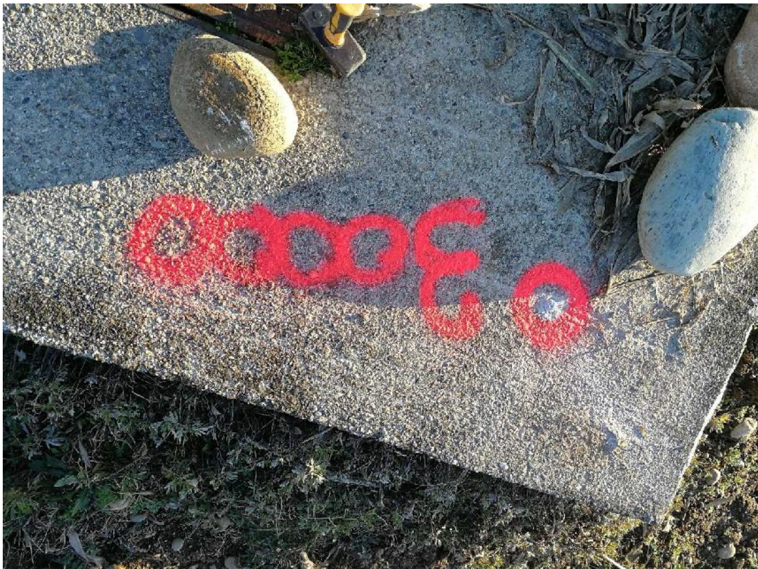
Foto n. A4 - chiodo punto 30 000