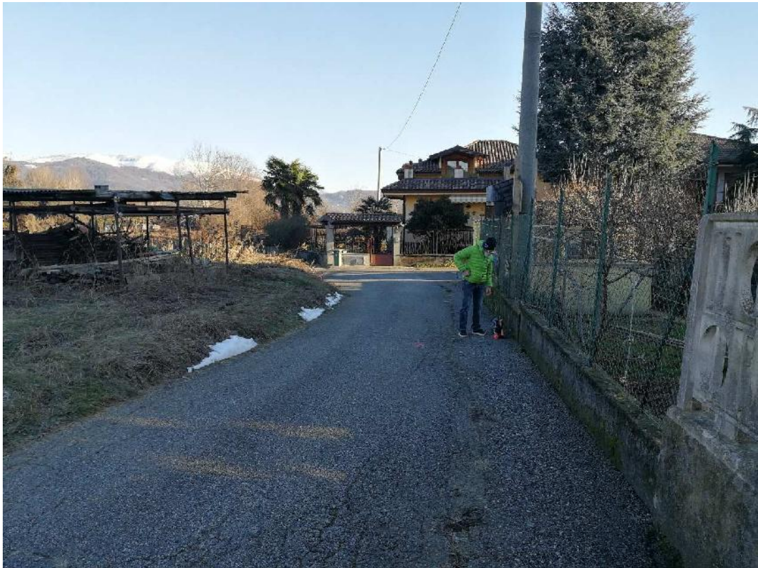
Foto n. A11 - chiodo punto 70 000