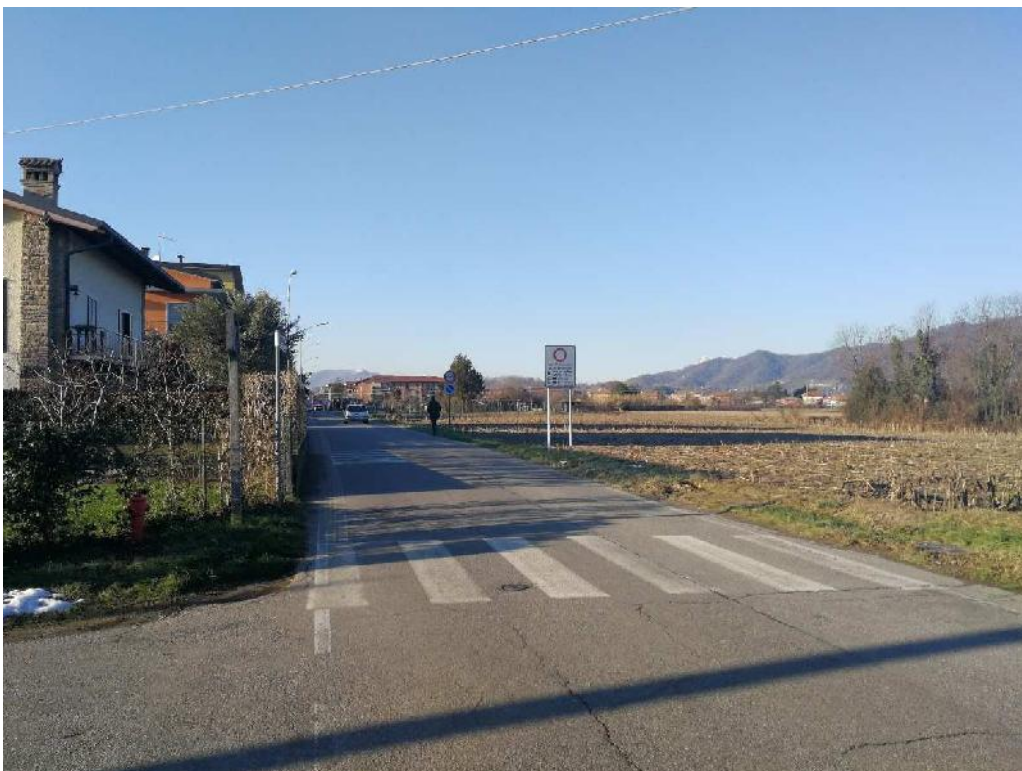
Foto n. 22 - Via Dante Alghieri direzione Calusco