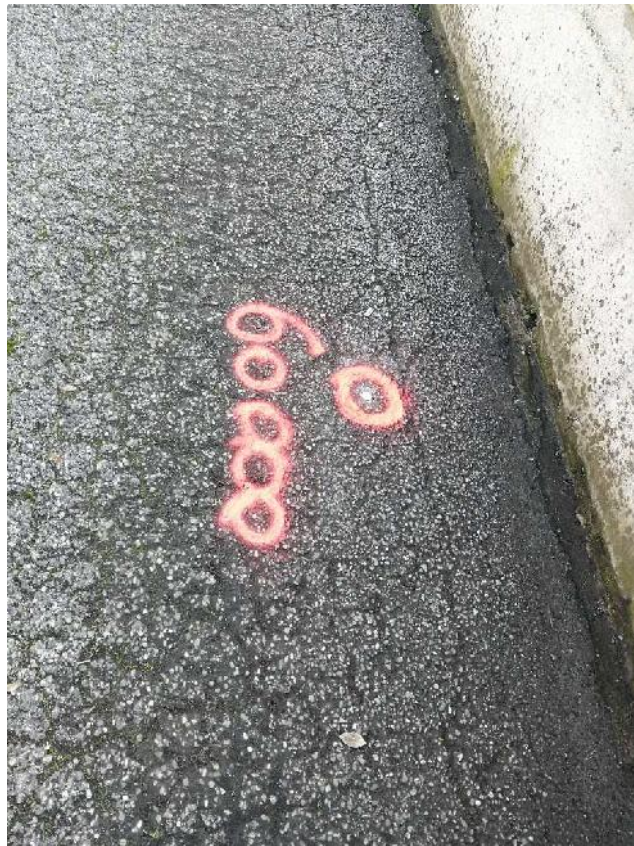
Foto n. A10 - chiodo punto 60 000