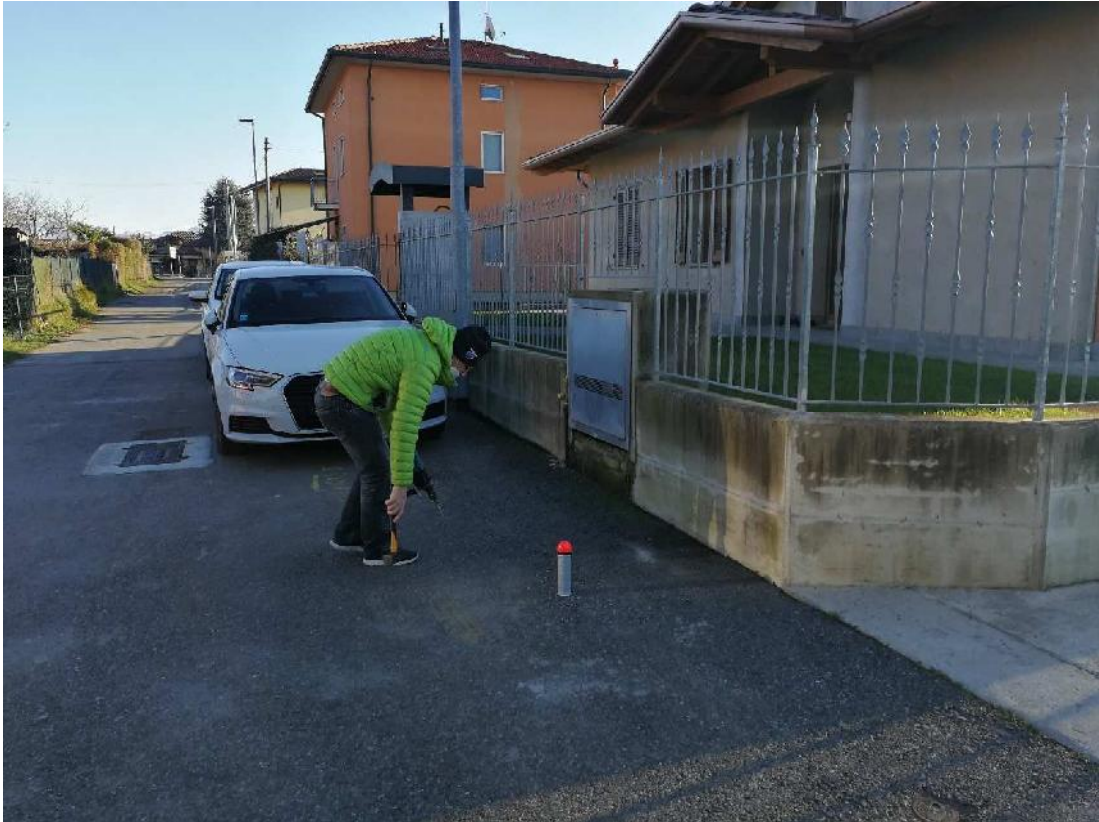
Foto n. A7 - chiodo punto 50 000