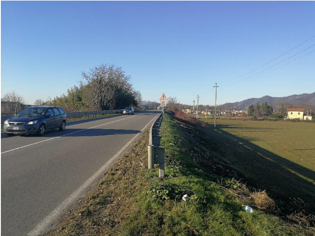
Foto n. 7 - Vista SP 170 direzione Calusco - Scarpata e strada di accesso ai fondi