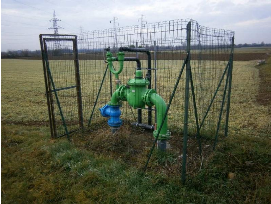
Foto n. 49 - Manufatti Consorzio di Bonifica non interessati dall'intervento