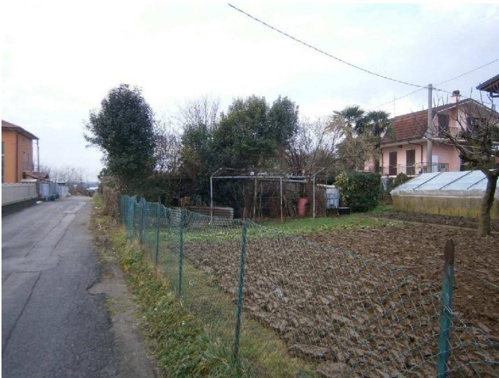
Foto n. 26 -- Via delle Brughiere