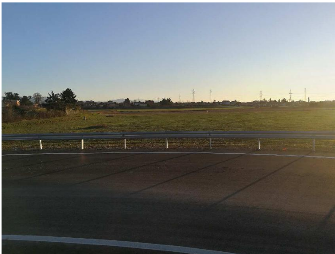
Foto n. 62 – Tratto di innesto lotto 2 su rotatoria via Rivalotto lotto 1