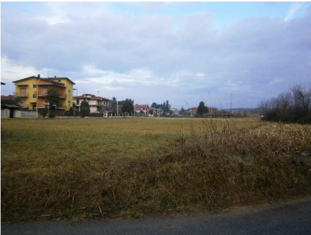
Foto n. 18 - via delle Brughiere