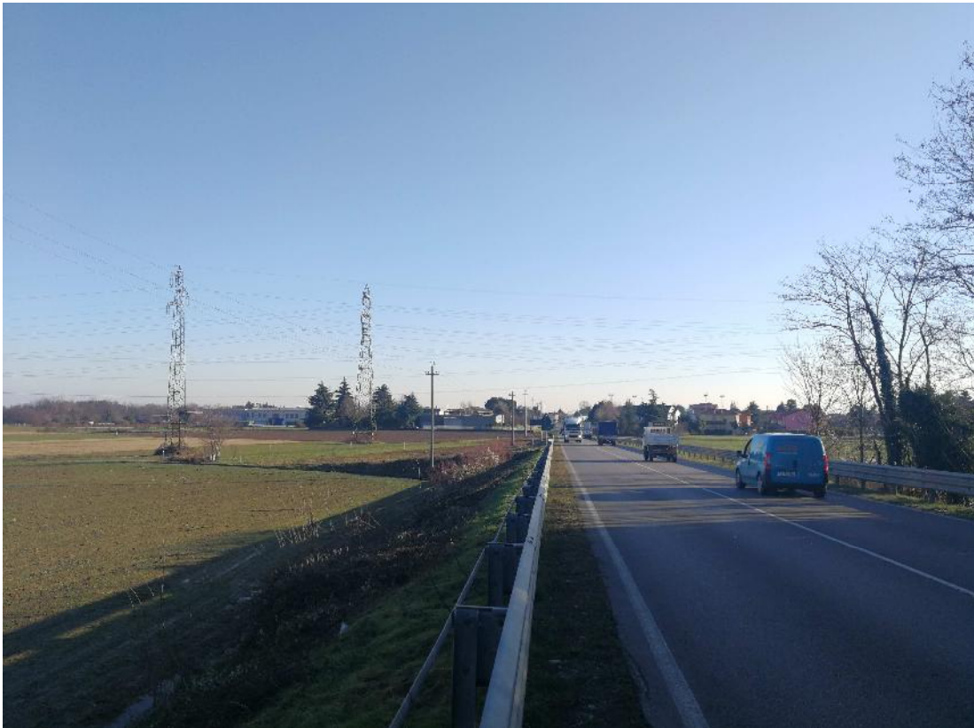
Foto n. 4 - Vista SP 170 in direzione Solza