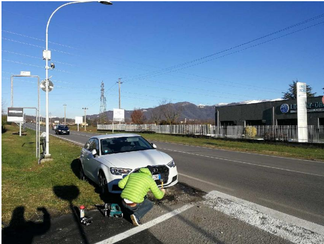
Foto n. A15 - chiodo punto 90 000