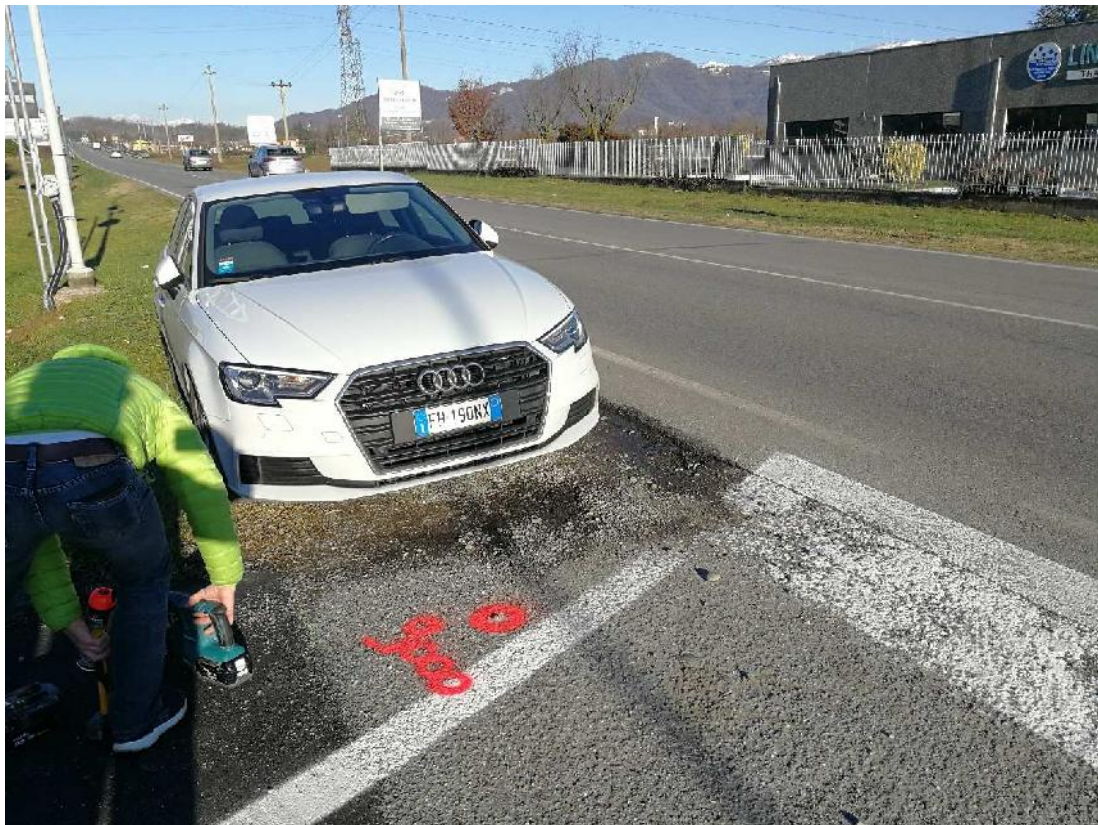
Foto n. A16 - chiodo punto 90 000