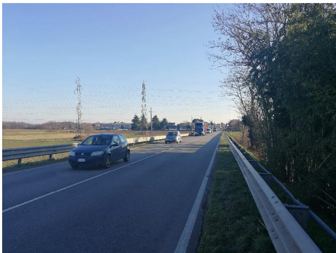
Foto n. 2 - Vista SP 170 in direzione Solza