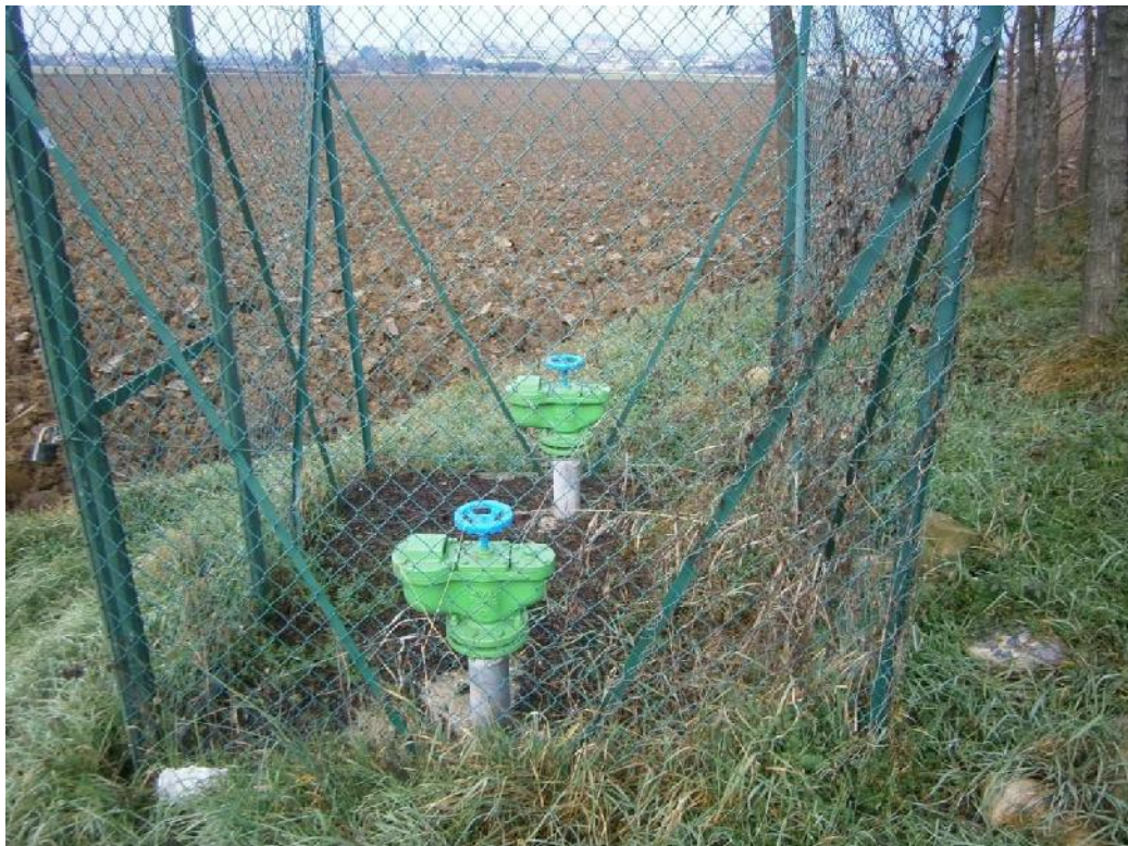
Foto n. 48 - Manufatti Consorzio di Bonifica non interessati dall'intervento