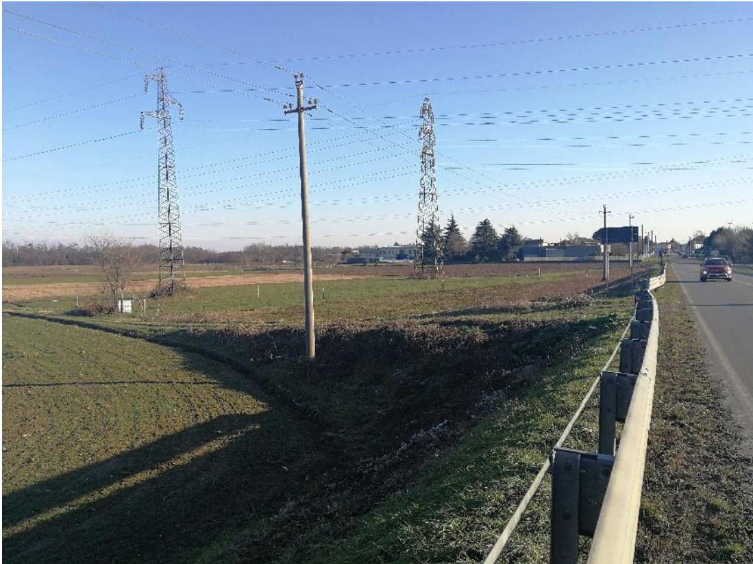
Foto n. 5 - Vista SP 170 direzione Solza - Scarpata e strada di accesso ai fondi