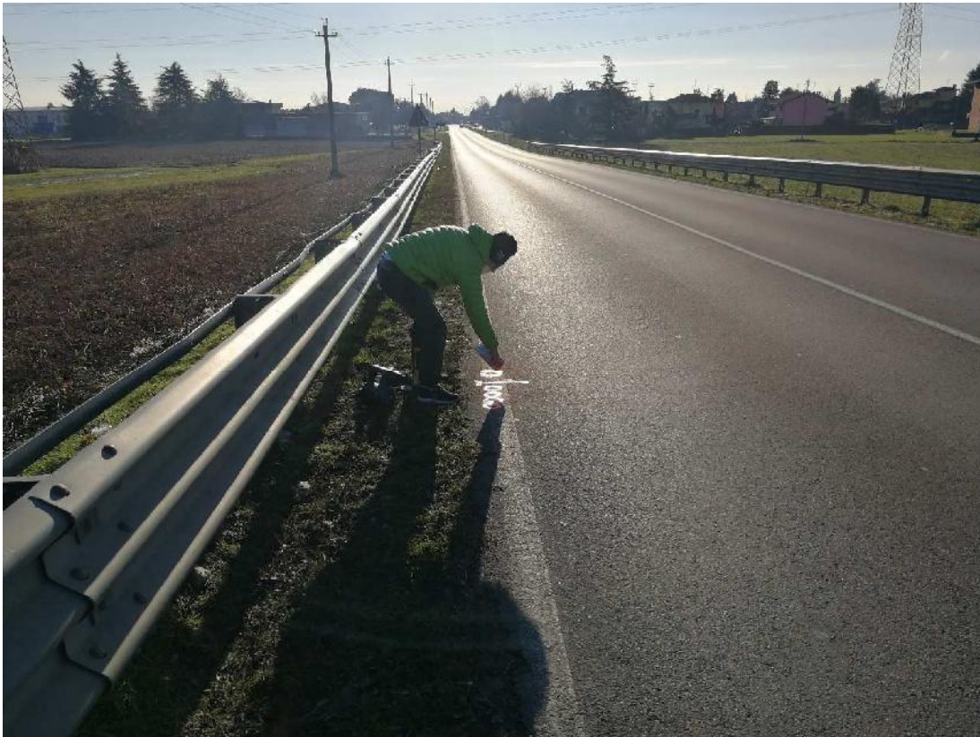
Foto n. A17 - chiodo punto 100 000