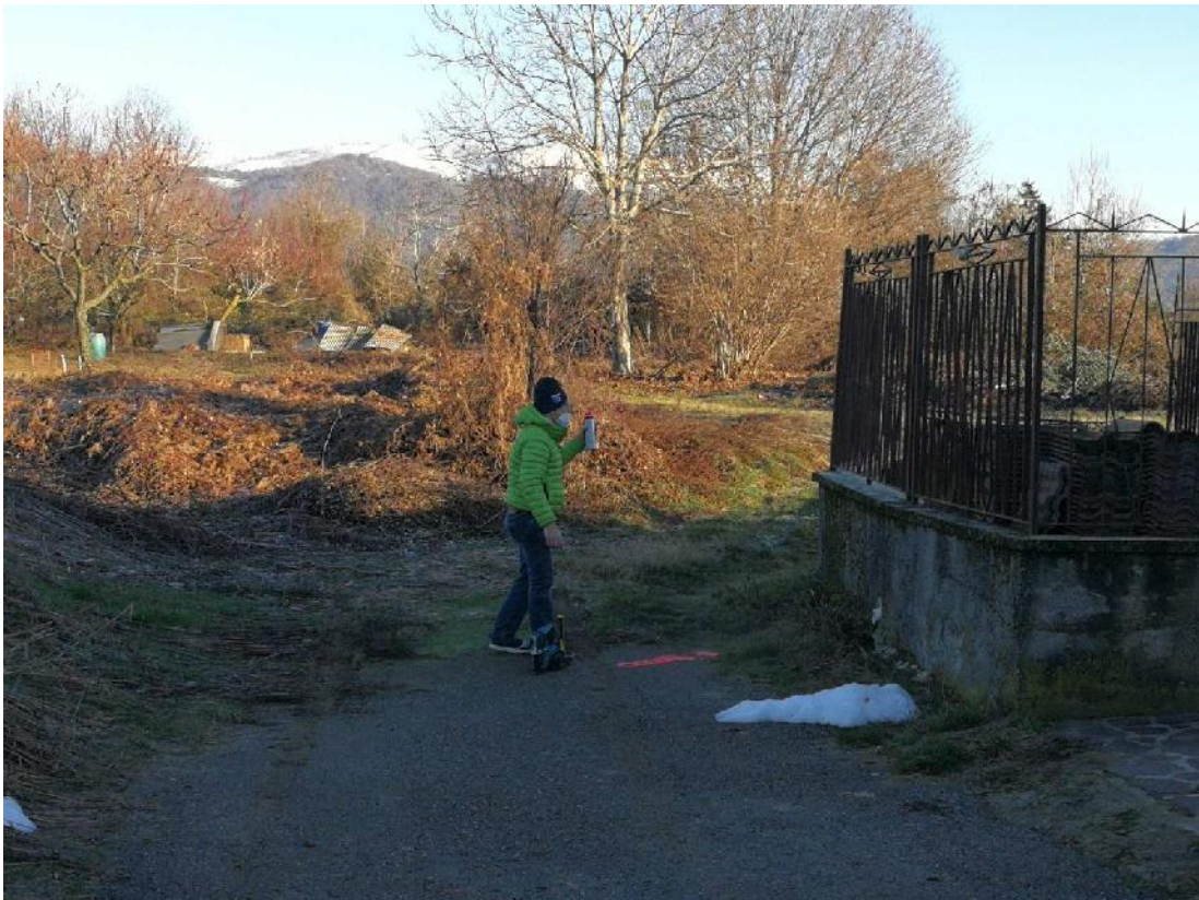
Foto n. A14 - chiodo punto 80 000