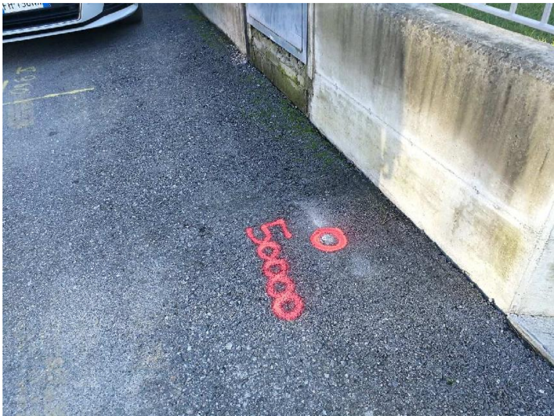
Foto n. A8 - chiodo punto 50 000