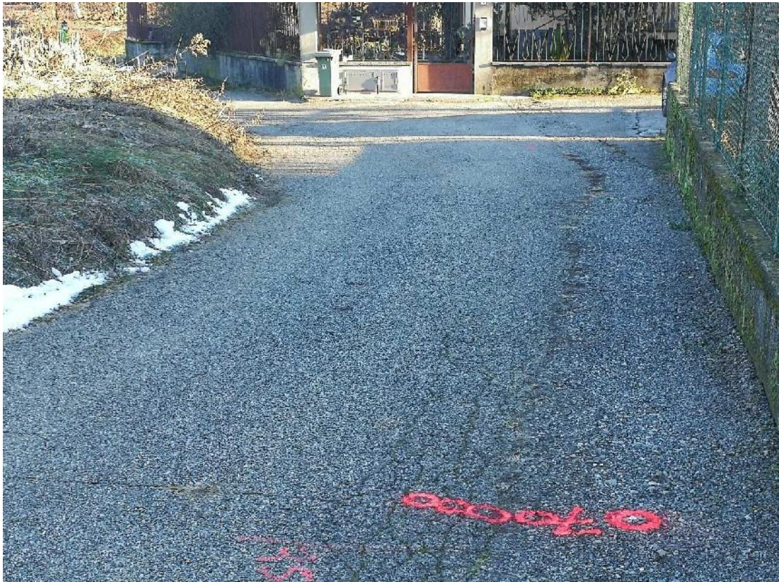
Foto n. A12 - chiodo punto 70 000