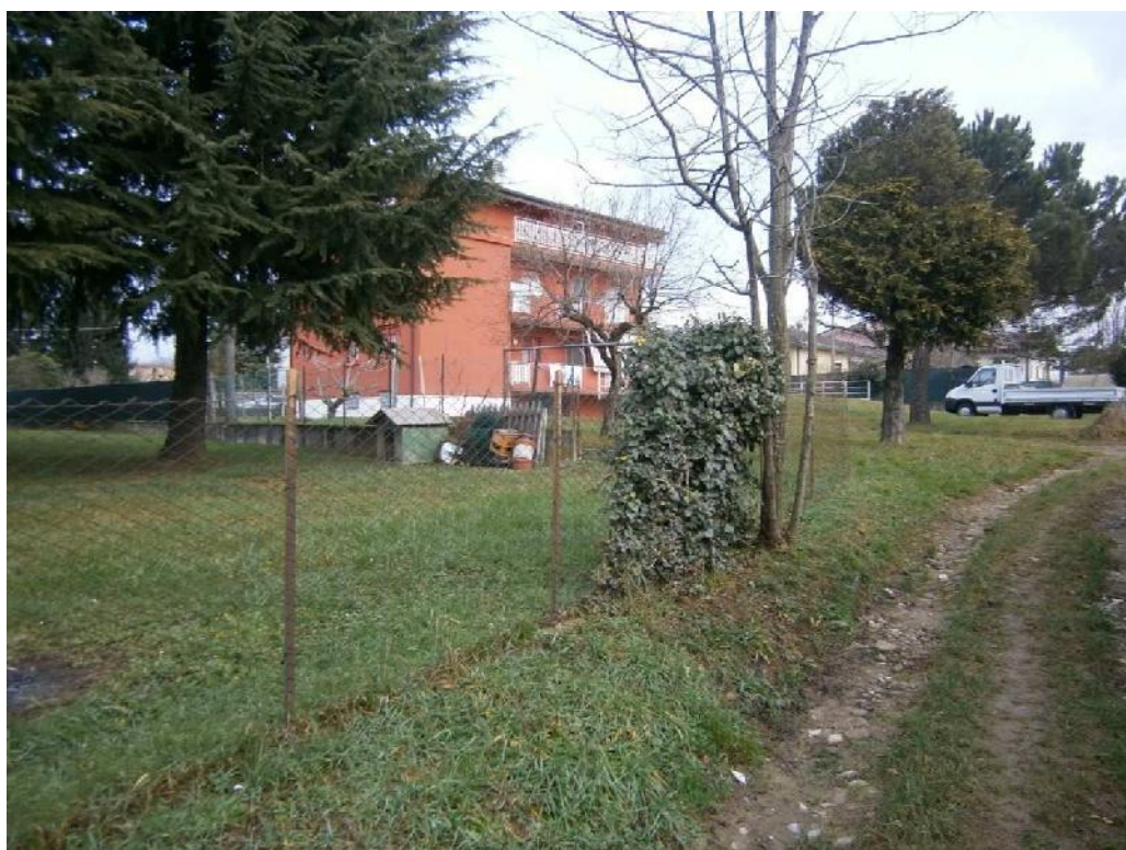
Foto n. 44 - Tratto campestre di via delle Burghiere