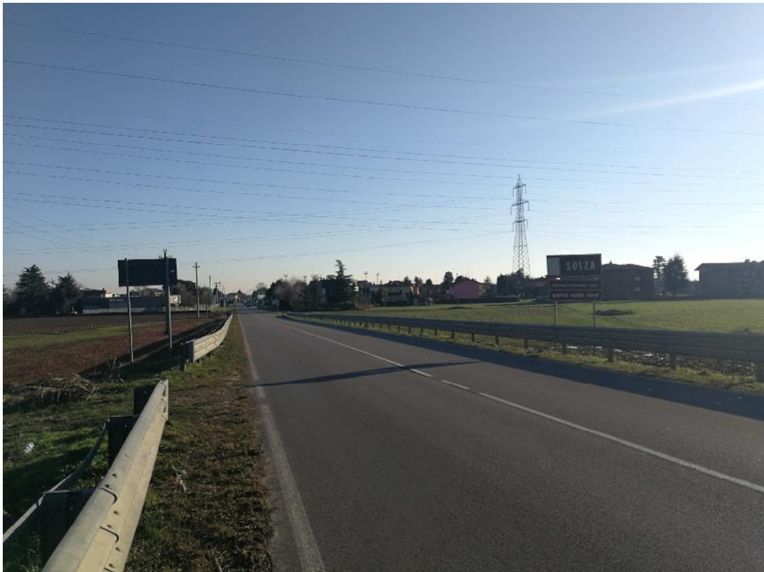
Foto n. 6 - Vista SP 170 direzione Solza - Scarpata e strada di accesso ai fondi