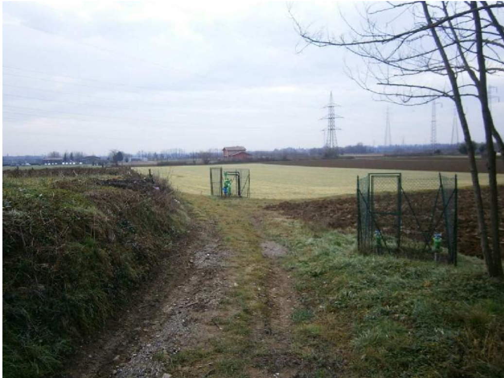
Foto n. 47 – Manufatti Consorzio di Bonifica non interessati dall'intervento