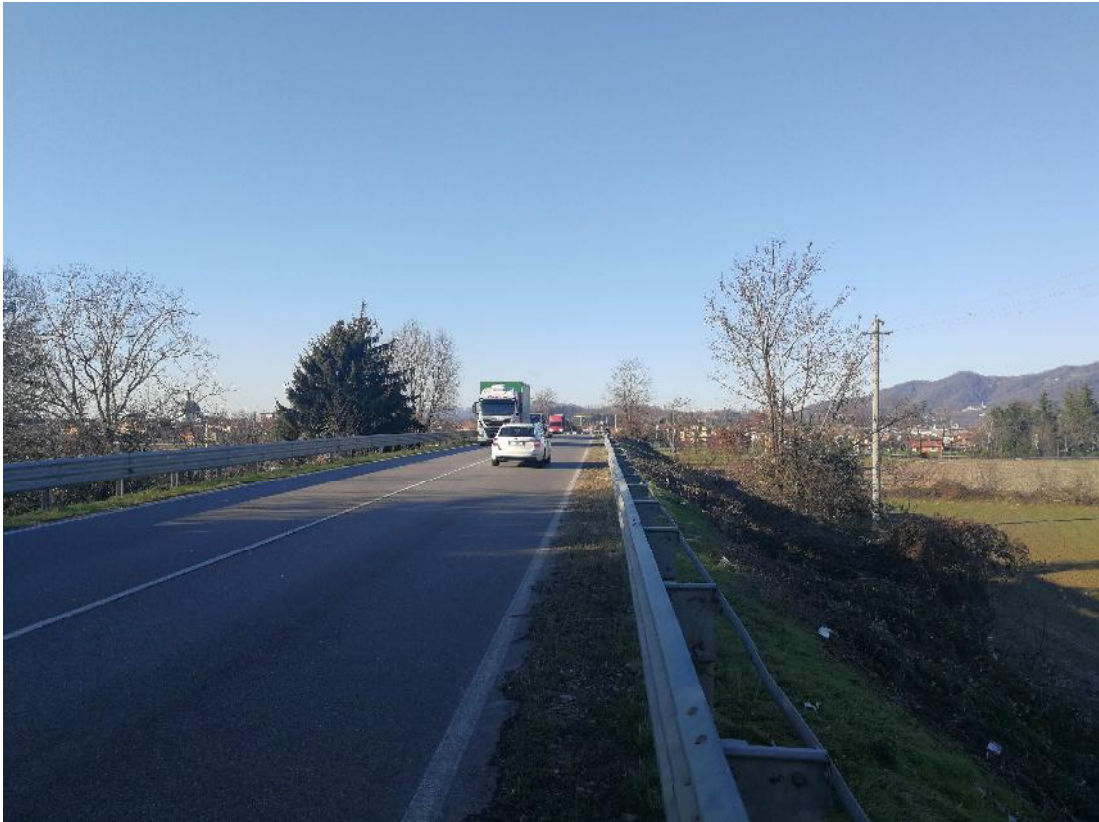
Foto n. 3 - Vista SP 170 in direzione Calusco d'Adda