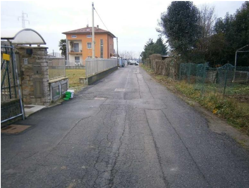
Foto n. 27 -- Via delle Brughiere