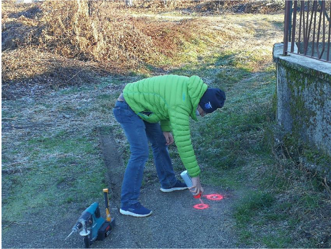
Foto n. A13 - chiodo punto 80 000