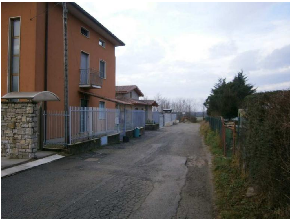
Foto n. 28 -- Via delle Brughiere