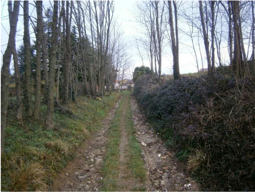
Foto n. 45 - Tratto campestre di via delle Burghiere