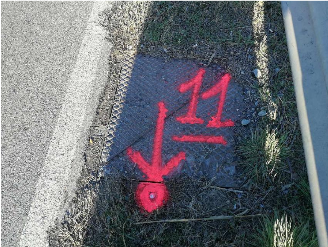
Foto n. A19 - chiodo punto 110 000