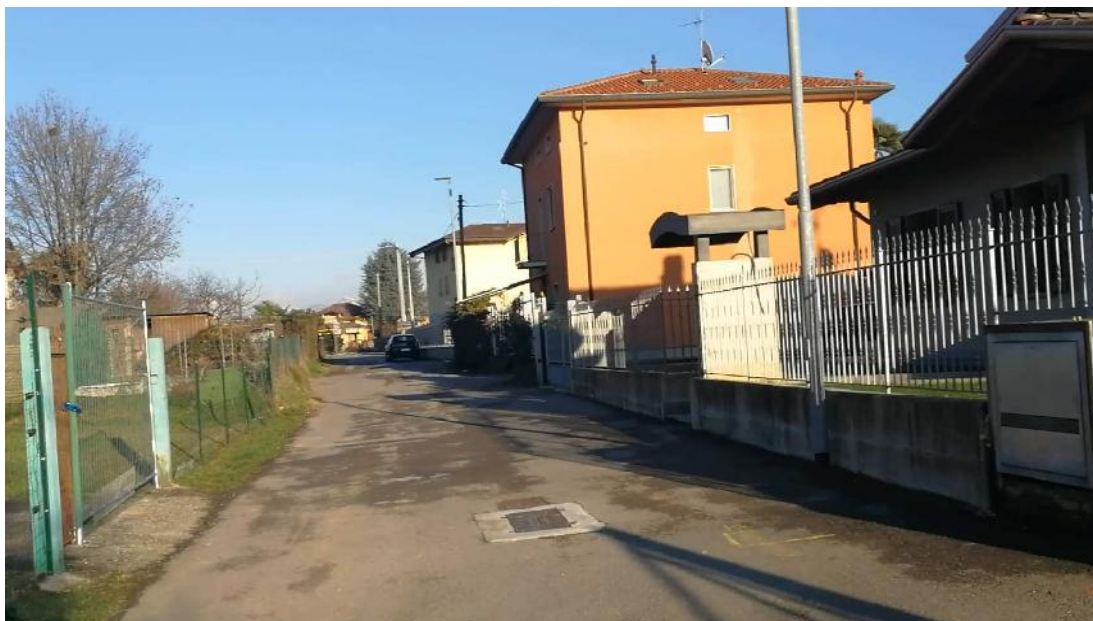
Foto n. 41 -- Vista Via delle Brughiere