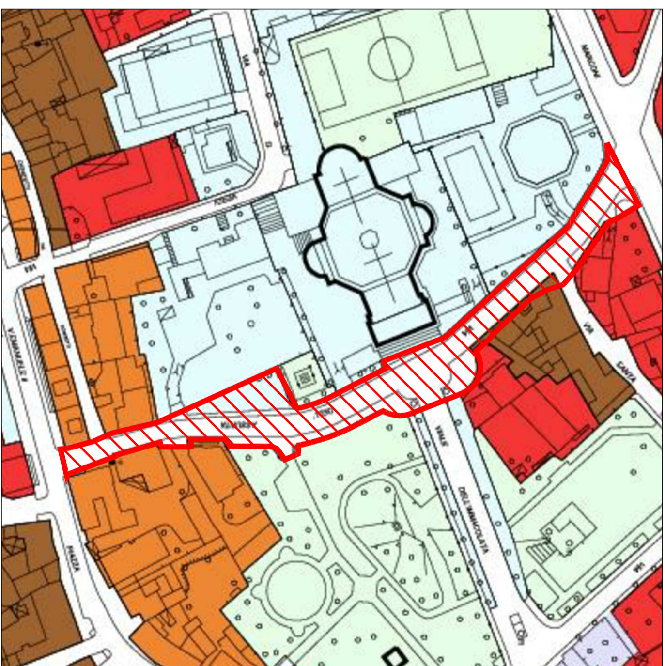
Estratto PGT – Piano delle Regole