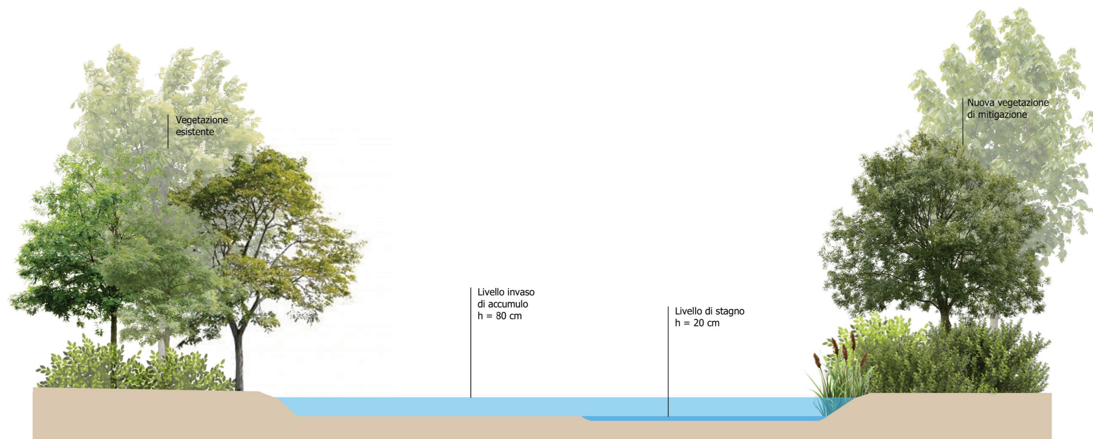
SEZIONE A-A' VASCA DI LAMINAZIONE scala 1:100

COMUNE DI CALUSCO D'ADDA (prov. di Bergamo)