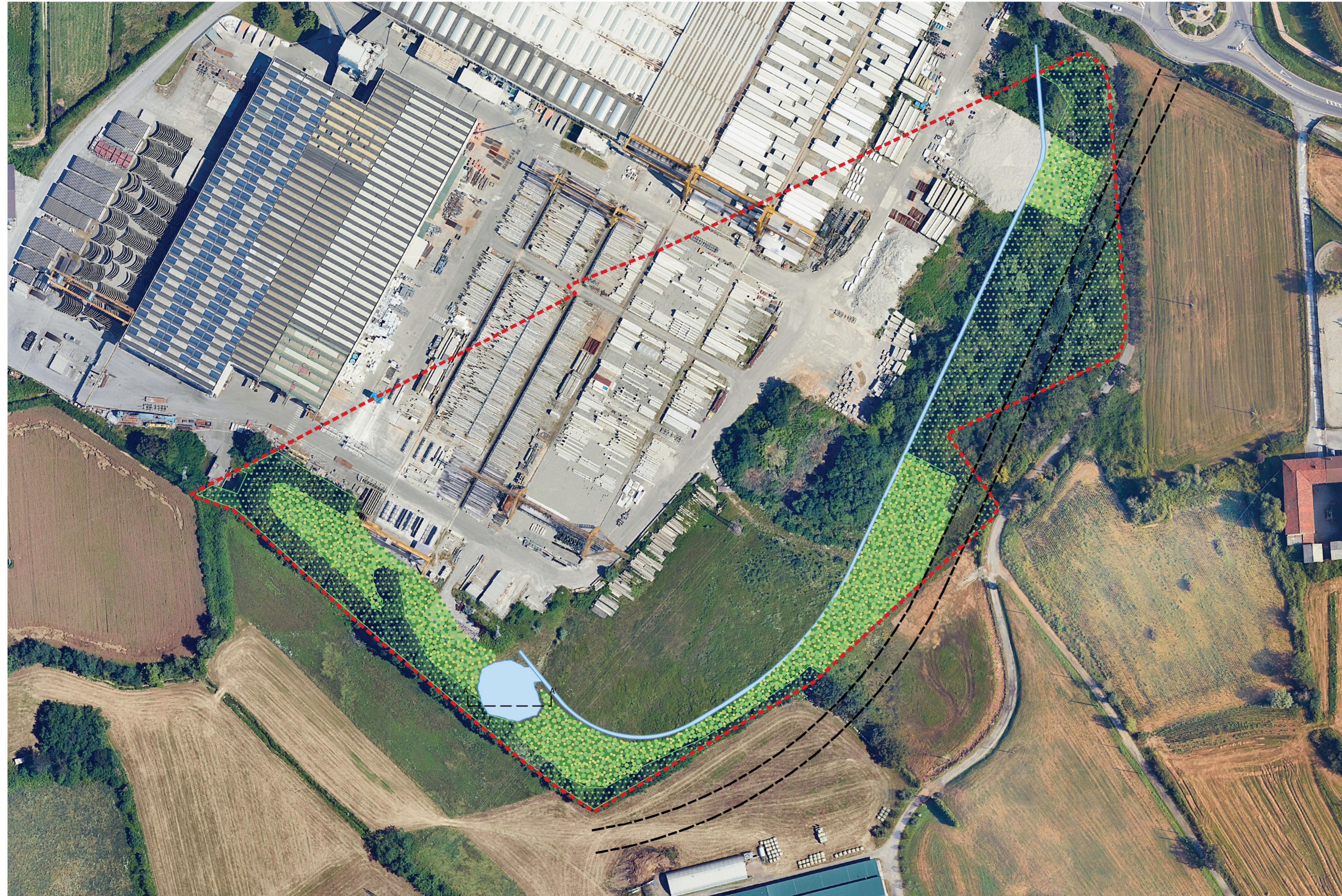
SCHEMA DI IMPIANTO PER FORMAZIONE DI MACCHIA BOSCATATA